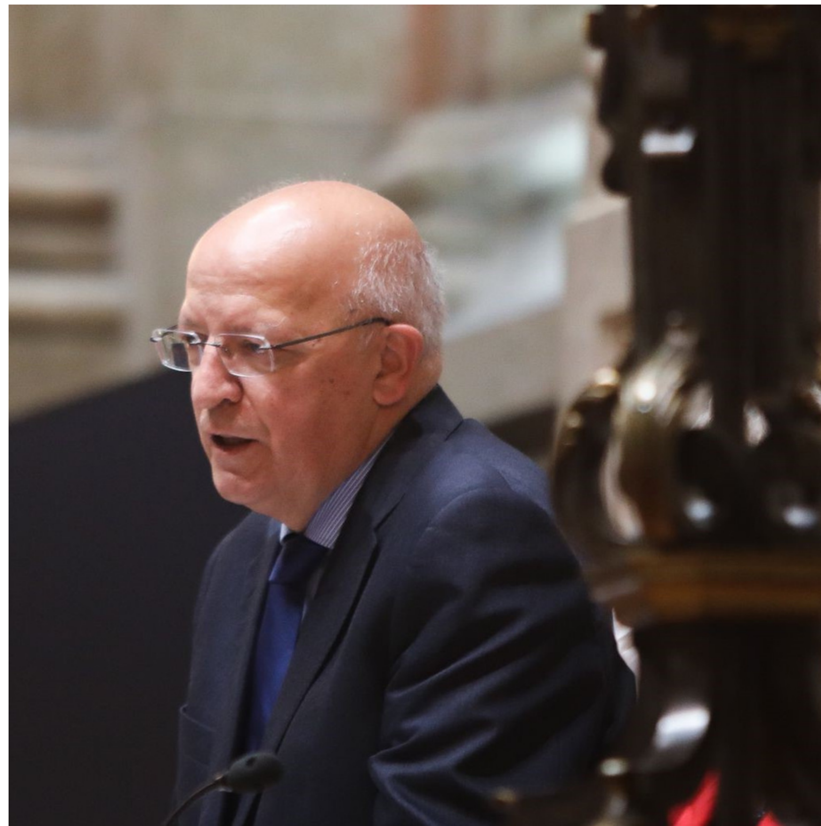
Augusto Santos Silva, presidente da AR

A solução pode passar por "inquirir os jovens" e "estar disponível para ouvi-los".